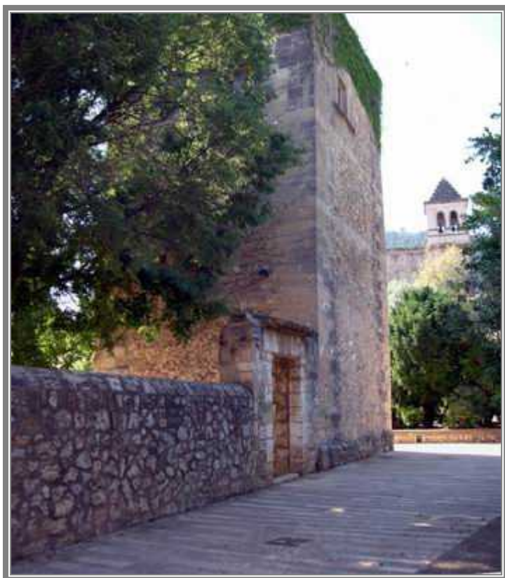
Jardins Joan March, detalle de la Torre Medieval.