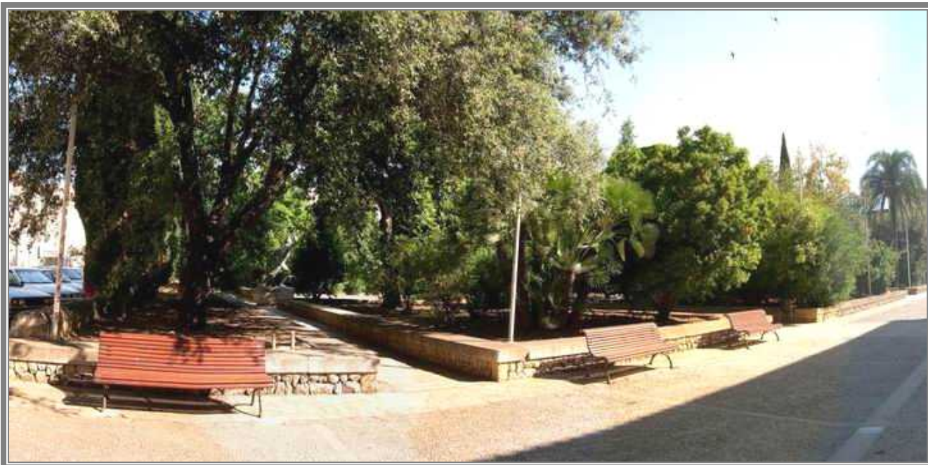
Jardins Joan March, vista panorámica desde la calle Convent.