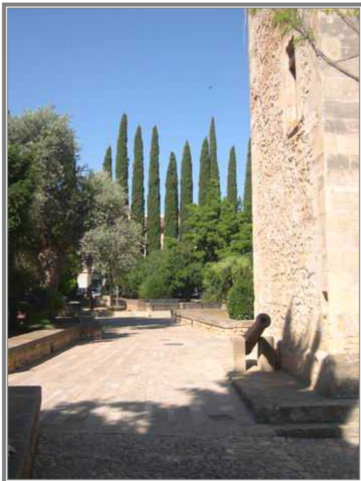
Jardins Joan March, detalle.