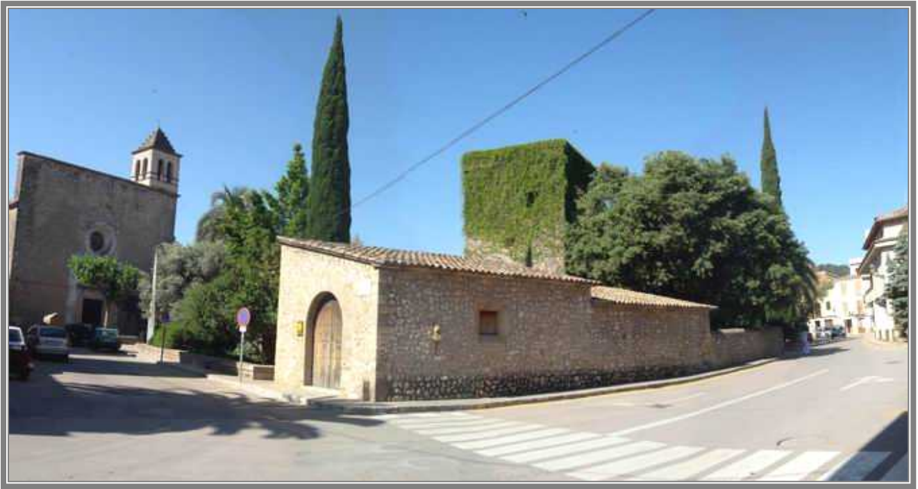
Jardins Joan March, vista panorámica desde la calle Sant Domingo.