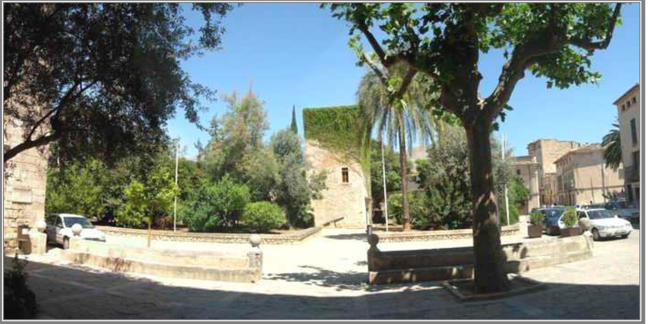
Jardins Joan March, vista panorámica desde la iglesia de Sant Domingo.