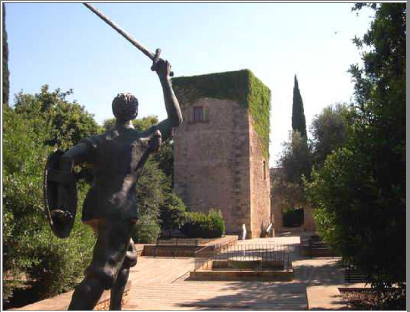
Jardins Joan March, detalle interior, al fondo la torre gótica.