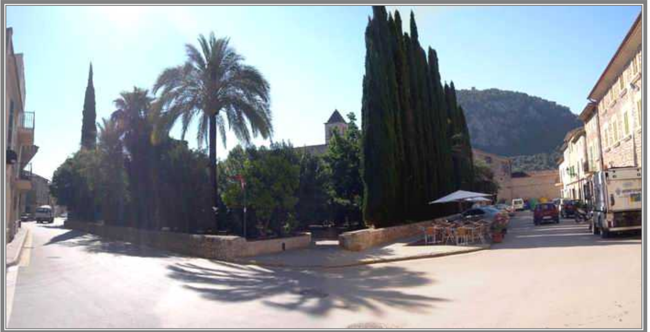
Jardins Joan March, vista panorámica desde la calle Miquel Capllonch.