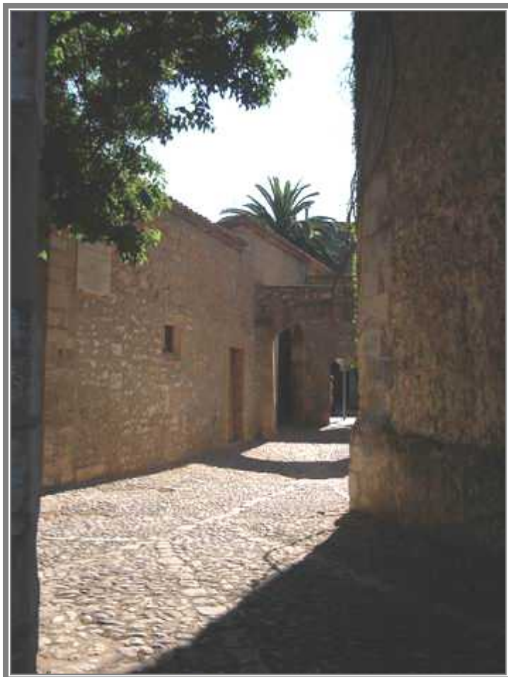
Jardins Joan March, detalle de los restos de la antigua construcción.