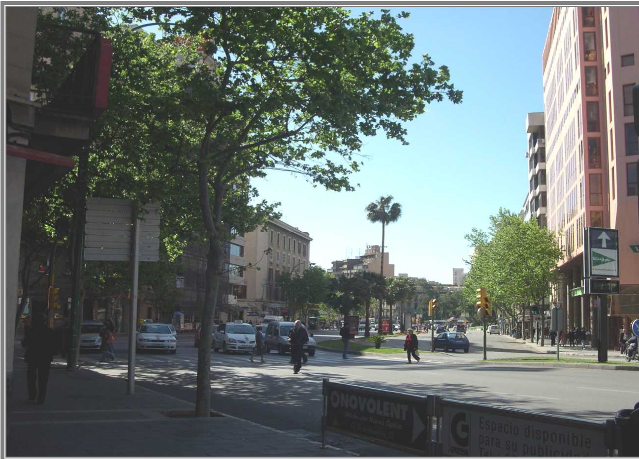
Panorámica de la Avinguda de Joan March desde la calle 31 de Diciembre. (CCV)