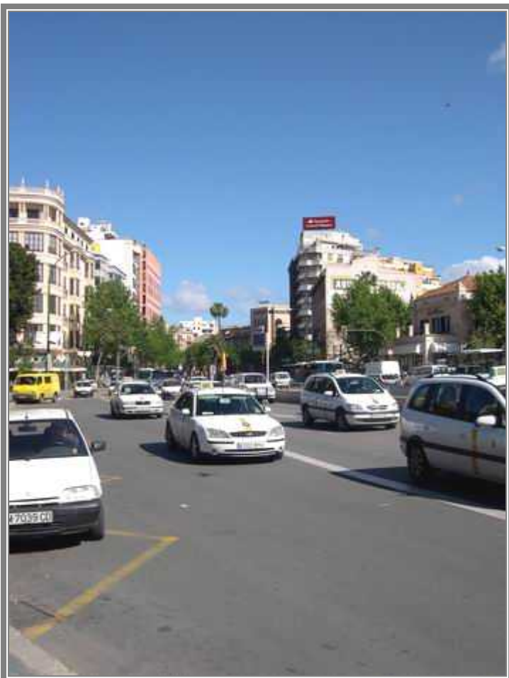
Vista de la Avinguda de Joan March desde la Plaza de España. (CCV)