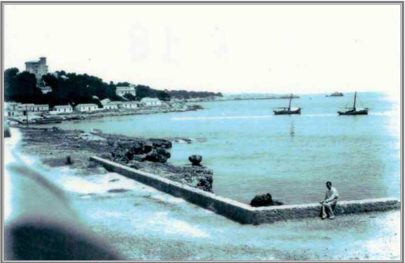
Cala Ratjada el día de la boda de Juan March en 1905, al fondo puede apreciarse el caserón que construyó su suegro en la cima de la colina, debajo a la derecha se puede ver la casa de veraneo del que sería presidente del gobierno Antonio Maura Muntaner.