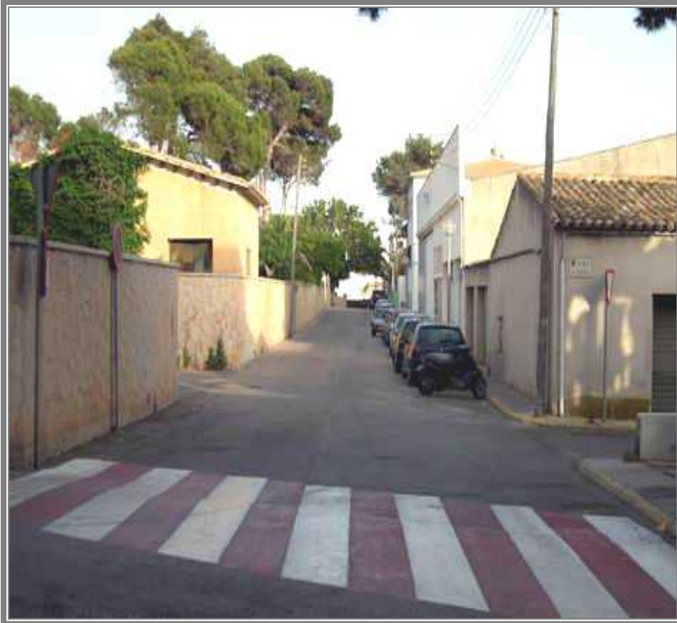
Vista del Carrer Joan March desde la Avenida Leonor Servera. (CCV)