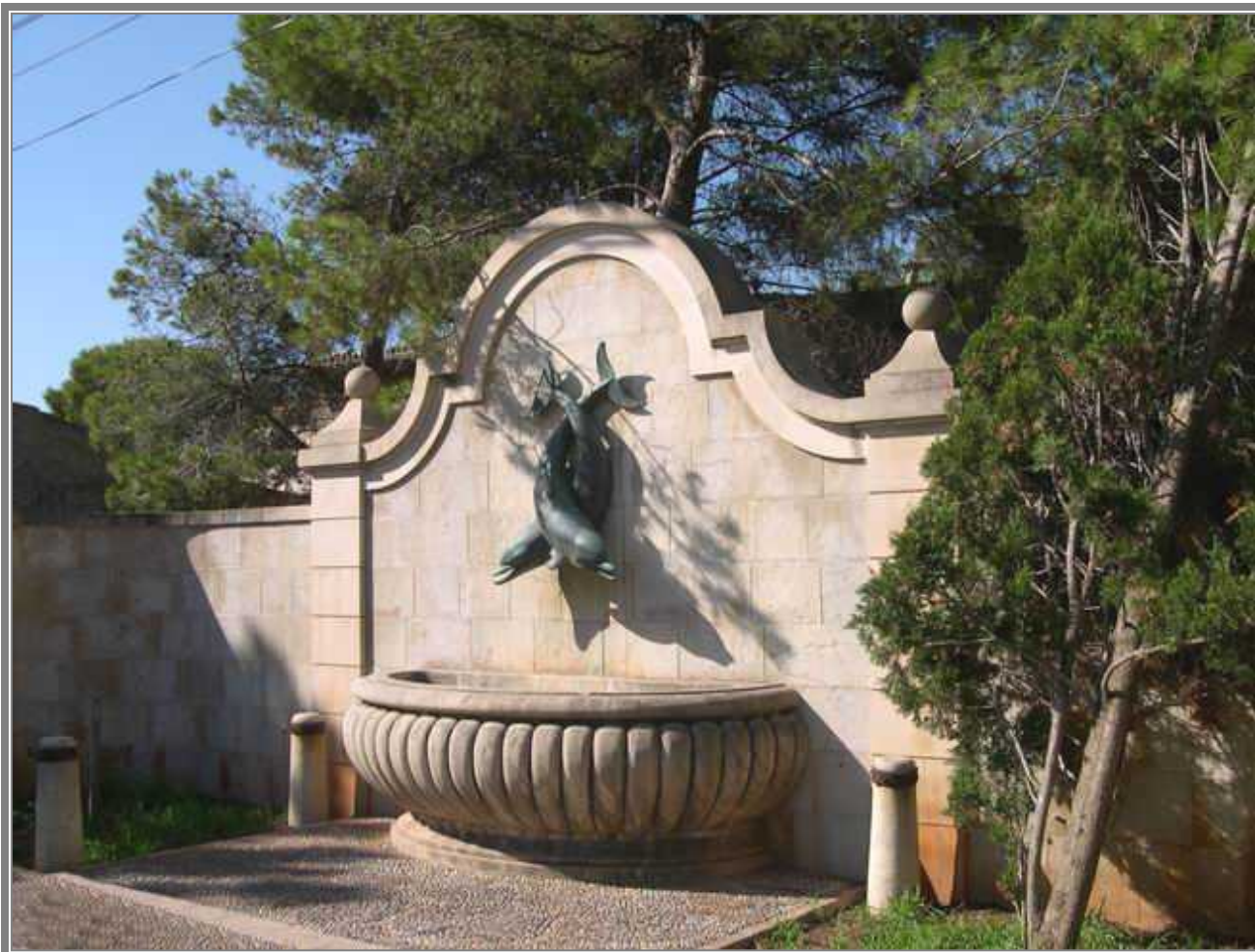
Carrer Joan March, detalle de la escultura situada frente a la entrada del Palacio. (CCV)