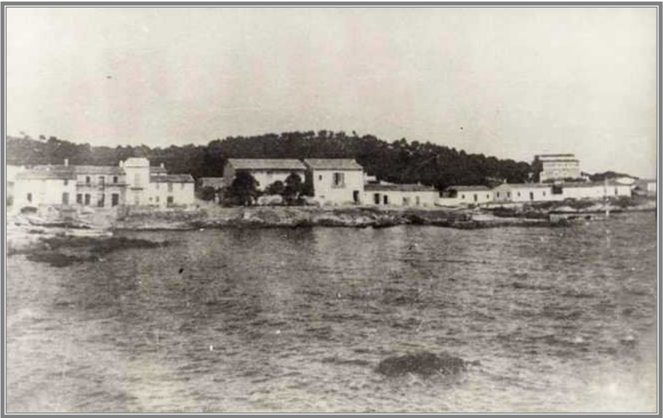
Curiosa fotografía de Cala Ratjada en 1890 “sin” Sa Torre Cega, el caserón que construyó el suegro de Juan March a principios del siglo XX en la cima de la colina, y que el magnate lo convirtió en el famoso Palacio March en 1916.