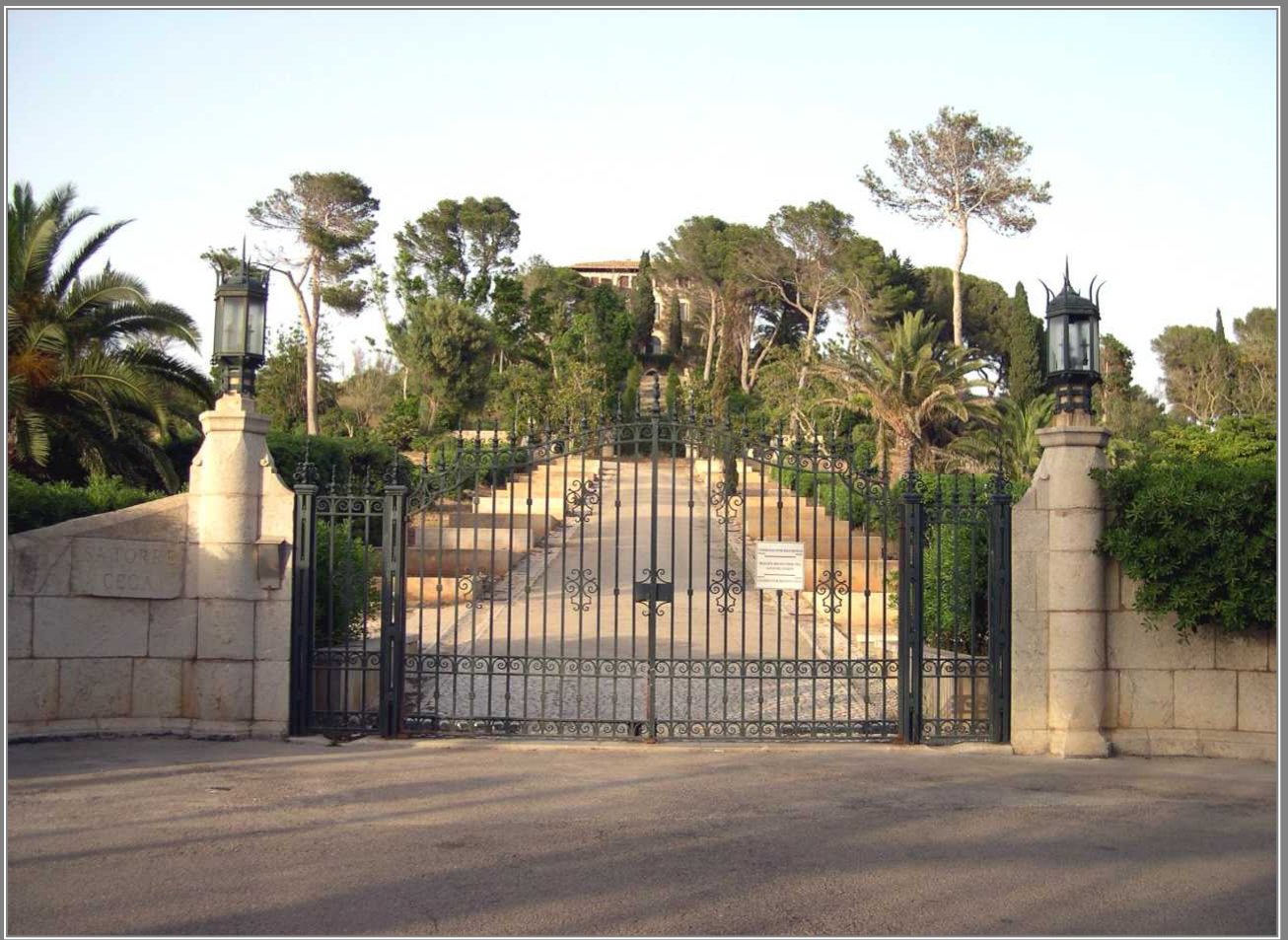
Carrer Joan March, detalle de la entrada al Palacio, al fondo en la cima de la colina el Palacio de Sa Torre Cega, más conocido por “Palacio March”. (CCV)