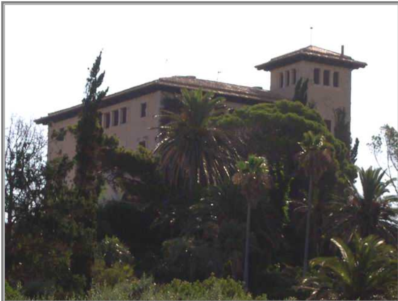
Fotografía actual del Palacio de Juan March en Cala Ratjada. (CCV)