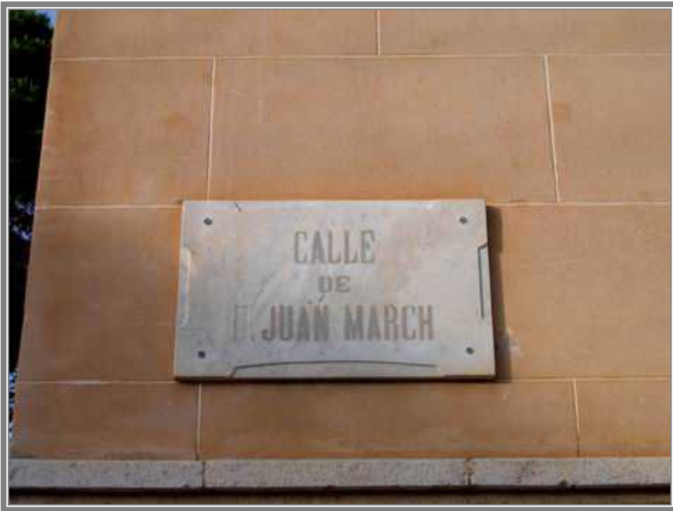
Detalle de la placa original adosada a uno de los edificios del Palacio March. (CCV)