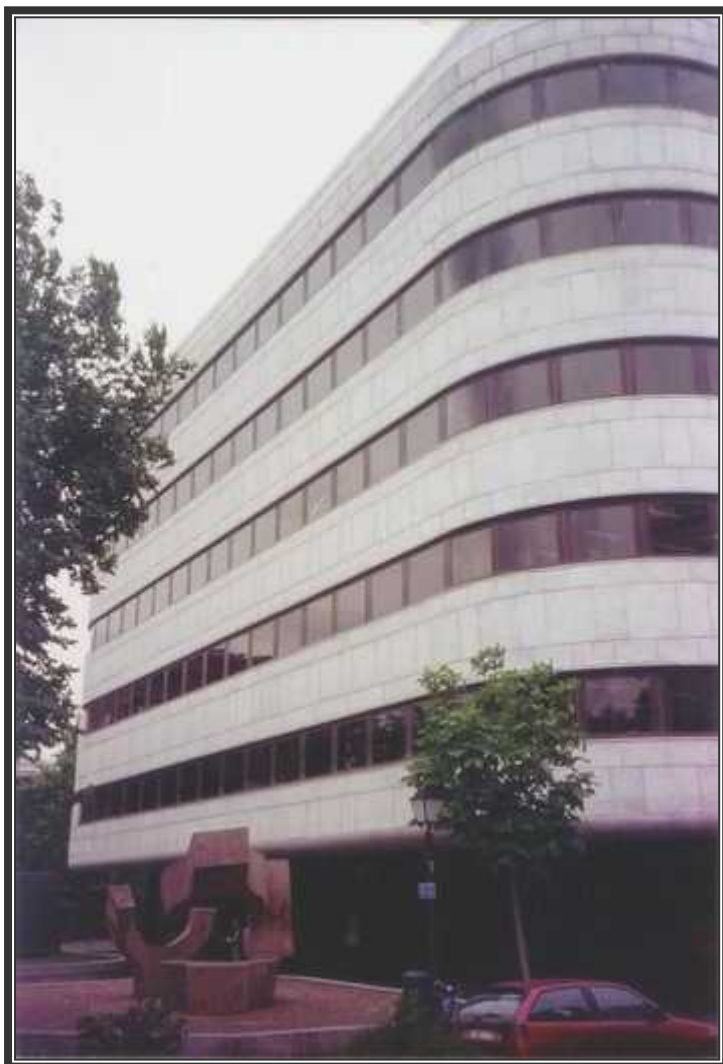
La sede de la Fundación Juan March en la actualidad.