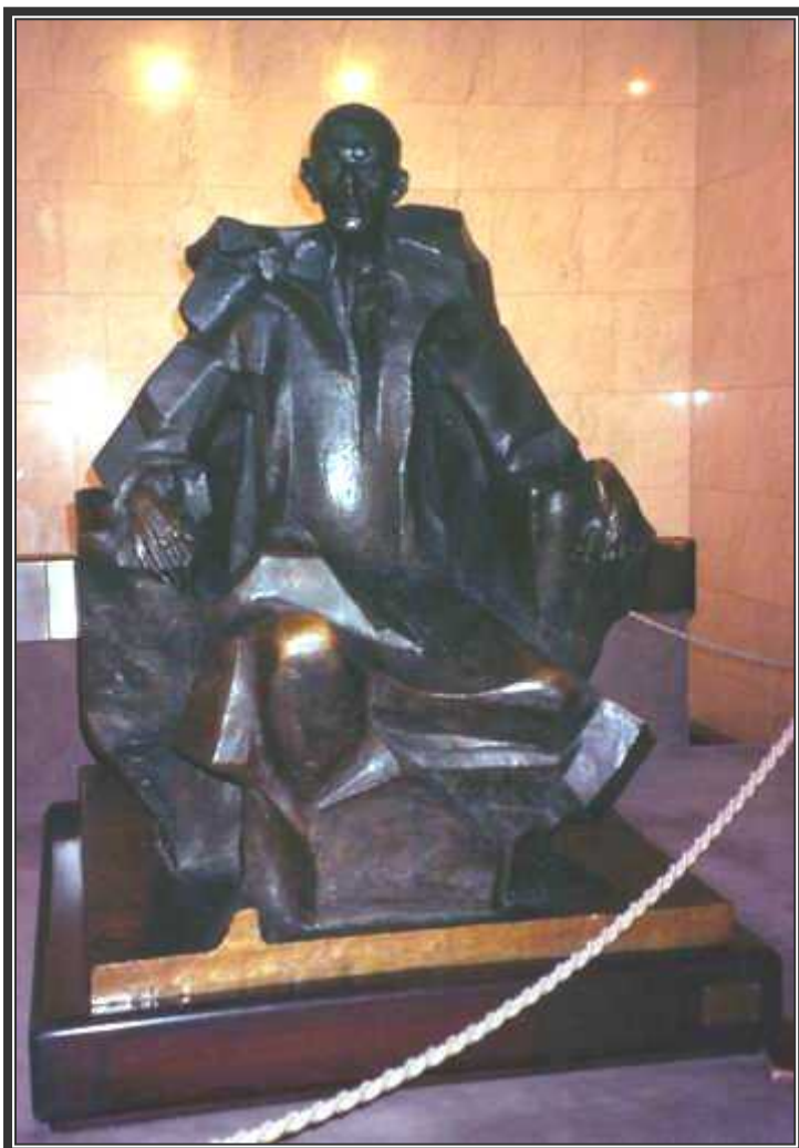
Escultura de don Juan March que preside la entrada de la Fundación.