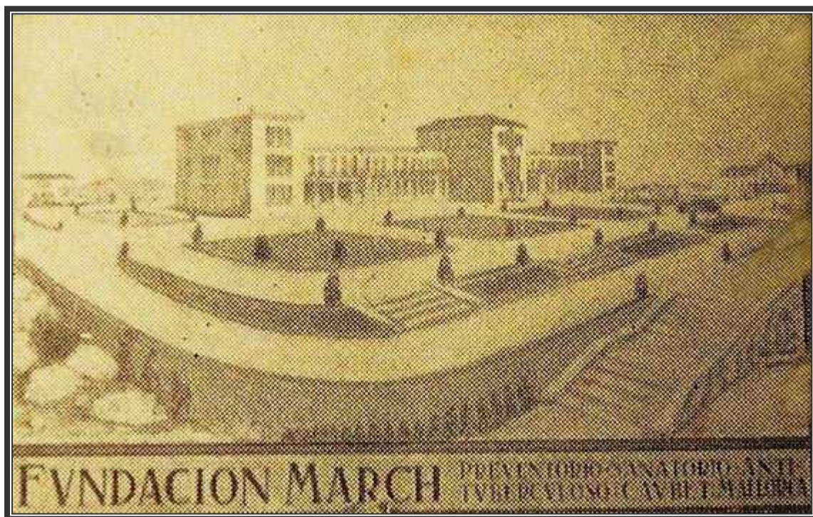
Cartel de la inauguración del Hospital Juan March, primer conato de la Fundación en 1938.

Tal era el aprecio que tenía el filántropo a esta obra, que dedicó una gran parte de su testamento a matizar las cláusulas del documento de constitución de la Fundación Juan March.