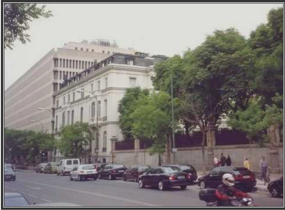
En primer plano los jardines y el Palacio de don Juan March, al fondo el edificio de la Fundación Juan March.