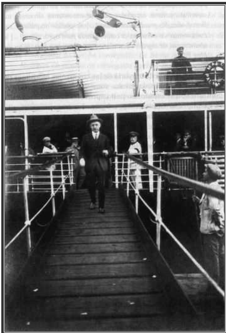
Juan March el propietario de Trasmediterránea bajando de uno de sus buques. (Los inicios de un imperio f.)