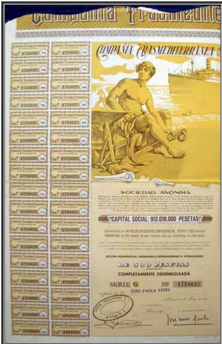
Acción de la Compañía Trasmediterránea.