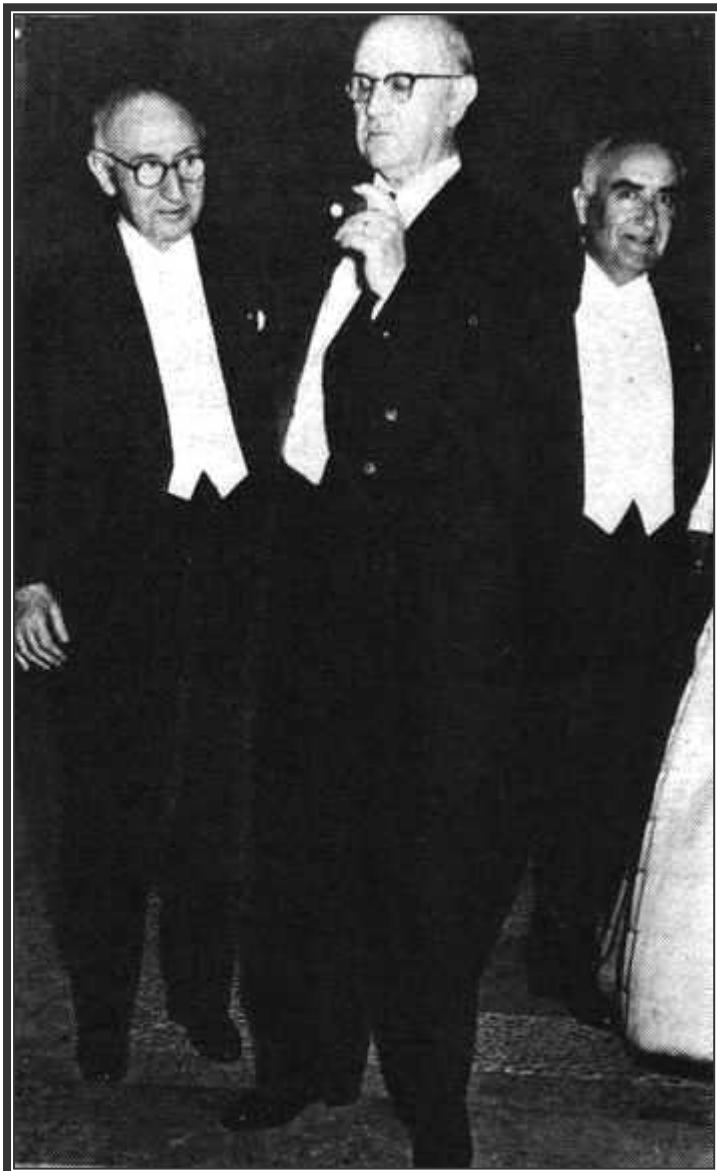
El presidente de Trasmediterránea con Juan March en la fiesta de presentación de su nieta en Madrid.