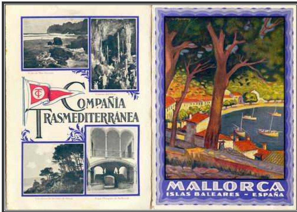
Bonito folleto de la famosa naviera con las tarifas de pasajes de 1928.