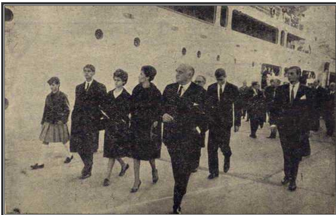
Los hijos y nietos del mecenas se disponen a acompañar a don Juan March en su último viaje a Mallorca.