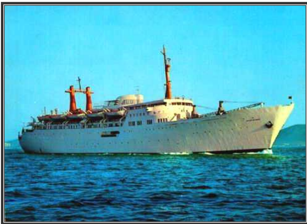
Don Juan March navegó de nuevo a través del buque de la compañía Trasmediterránea que llevaba su nombre desde 1966 hasta 1985.