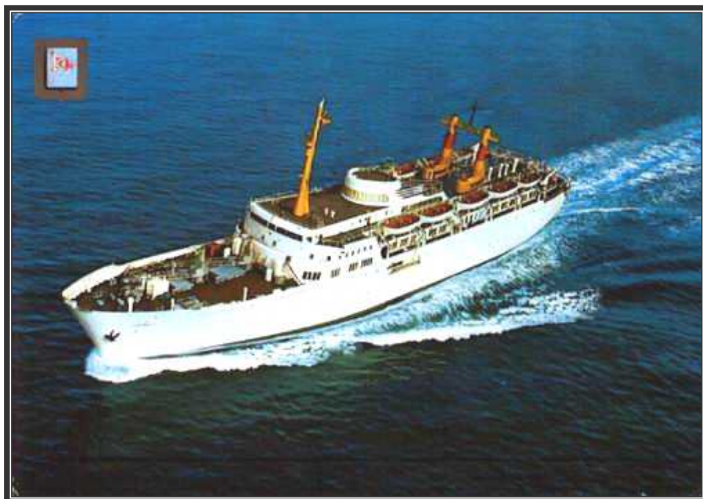
El buque Juan March surcando los mares.

Después de la muerte de don Juan March se botó un buque que llevaría su nombre durante dos décadas, el cual por cierto sufrió un incendio coincidiendo con la venta de la emblemática compañía marítima de don Juan March por parte de sus herederos en 1977.