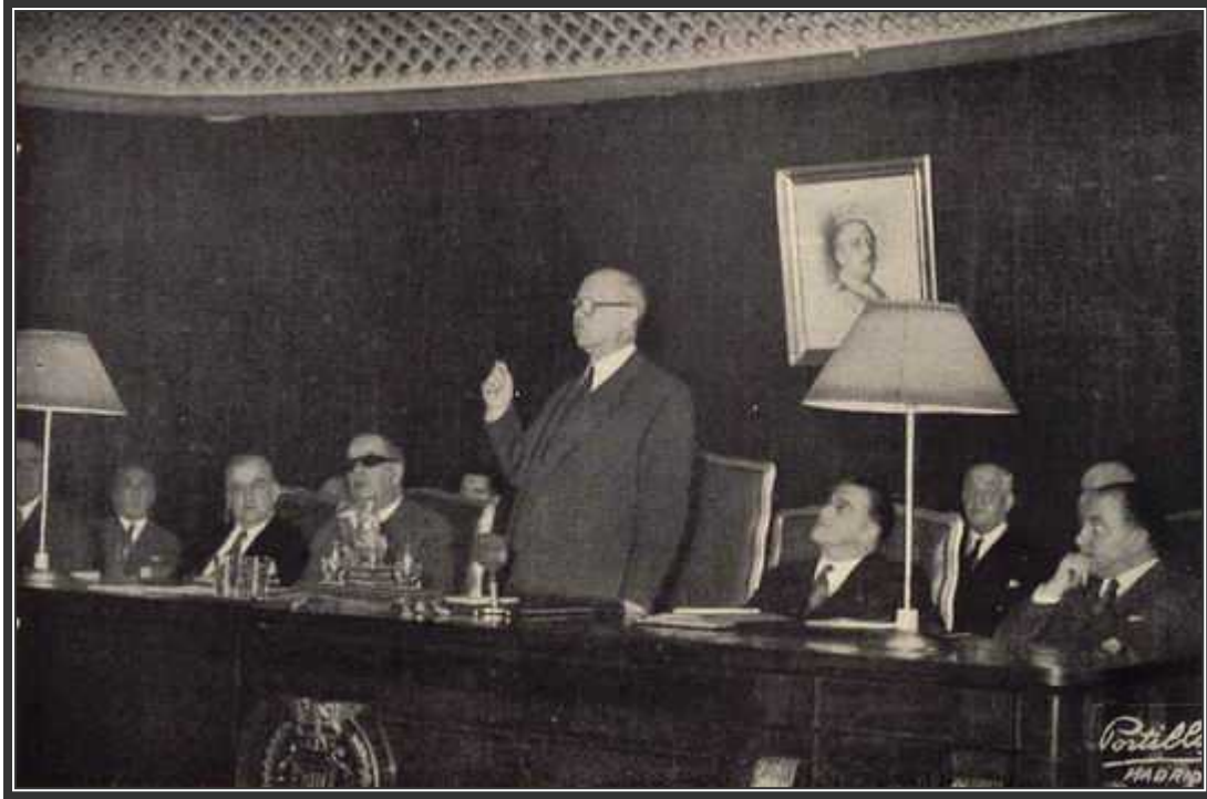
El presidente de Trasmediterránea en una junta extraordinaria de la compañía.