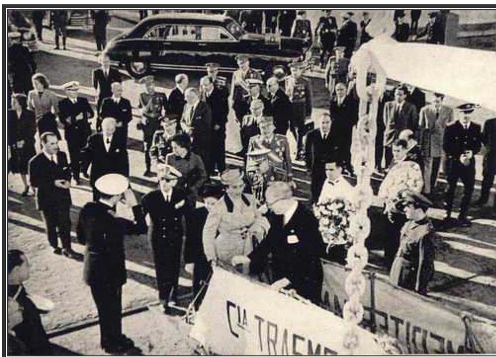
Franco y su esposa accediendo a uno de los barcos de Trasmediterránea.