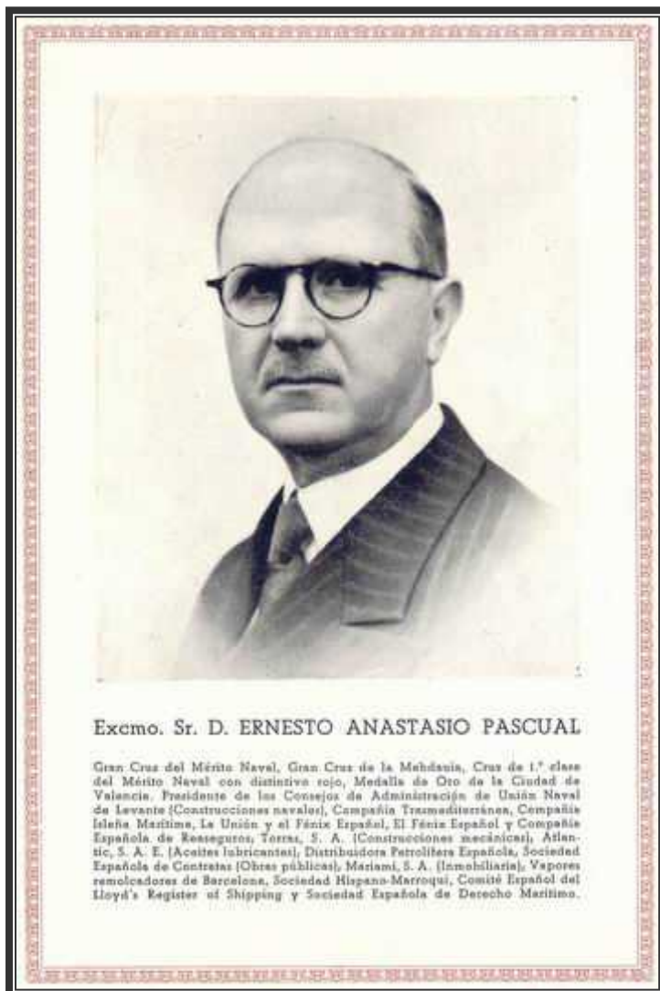
El Presidente de Transmediterránea con motivo de sus Bodas de Oro.